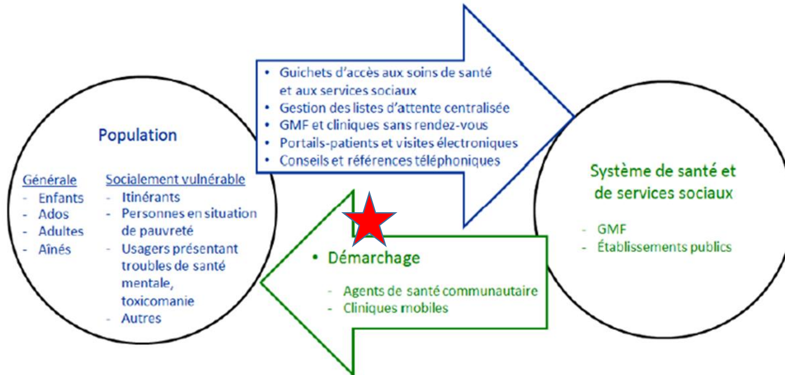
Figure 1 Système de mécanismes d'accès aux services de proximité

Tiré d'une œuvre de l'Institut national d'excellence en santé et en services sociaux, Direction des services sociaux, Mécanismes d'accès aux services de proximité, 2019